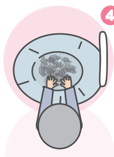
細かくちぎった新聞紙を入れ完成!