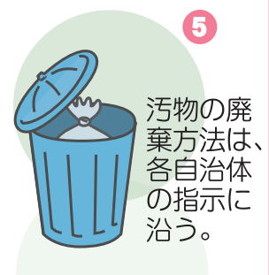
使用後はフタつきごみ箱へ捨てる。