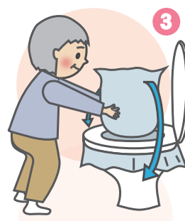
2枚目のポリ袋をかぶせる。