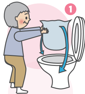
便座を上げ、便器にポリ袋をかぶせる。