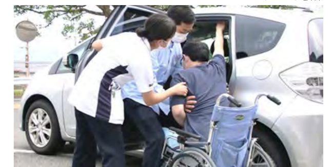
ご家族への介助指導